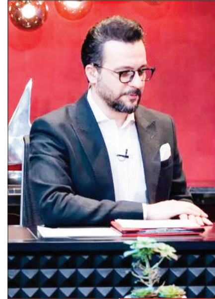
شکست ماه | افت مخاطبان تلویزیون