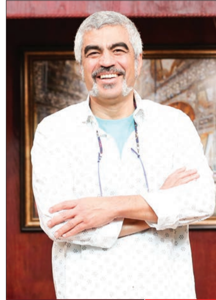
حذف ماه | کتاب باز بدون صحت؟