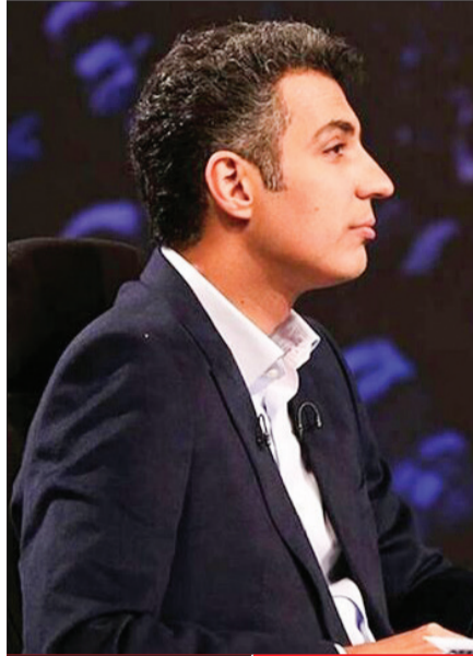
پر خبر ماه | عادل نیست و هست