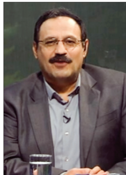
تعطیلی ماه | حذف چاپ اول و شهر فرنگ