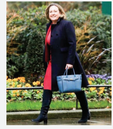
شکایت کردند که یکی از نمایندگان هم‌حزبی آنها در پارلمان بریتانیا مشغول تماشای فیلم هرزه‌نگاری در گوشی تلفن همراه خود بوده است.

آن ماری ترولیان، وزیر بازرگانی بریتانیا گفت که تمام زنان شاسلر در پارلمان این کشور مورد لمس نامناسب در محل کار خود قرار گرفته‌اند یا با واژه‌های جنسیت‌زده با آن‌ها صحبت شده است. وی به همکاران مرد خود در پارلمان توصیه کرد که سرشان به کار خودشان باشد. ترولیان به اسکای نیوز افزود: «من فکر می‌کنم همه ما به‌عنوان زنان عضو پارلمان مورد خطاب با زبان نامناسب و یا هدف دست‌های سرگردان قرار گرفته‌ایم... هیچ جای این موضوع در دست نیست. در وست‌مینستر اپارلمان بریتانیا هم خوب نیست.» وی تأکید کرد: «اگر آدم هستید سرتان به کار خودتان باشد. مانند زمانیکه دخترتان در اتاق است، رفتار کنید.» رفتار نمایندگان پس از آن مورد توجه قرار گرفت که حزب حاکم محافظه‌کار این هفته گفت که در حال بررسی ادعاهایی مبنی بر تماشای فیلم‌ها هرزه‌نگاری از سوی یکی از نمایندگان در صحن پارلمان است. گروهی از نمایندگان زن حزب محافظه‌کار از بورس جانسون