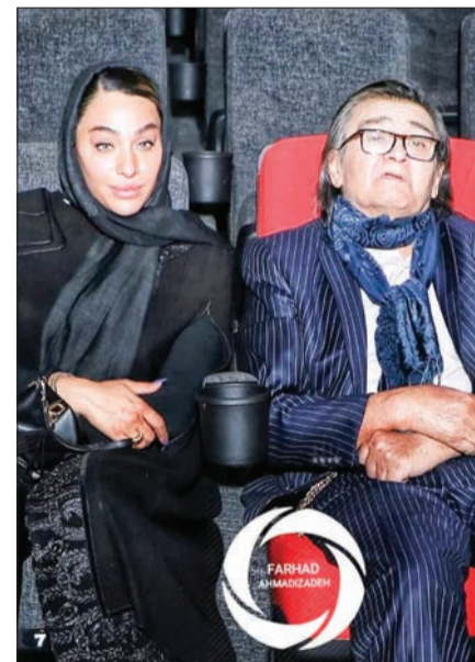
همدلی ماه | فصل توجه به رویگری