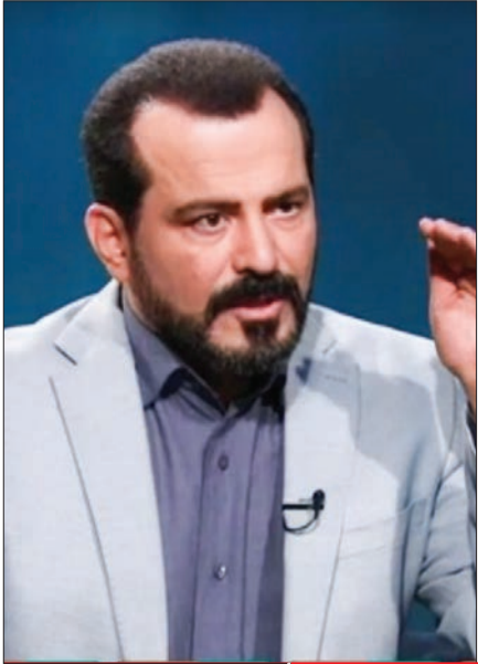
مجادله ماه | بحث داغ خروج موقت روح