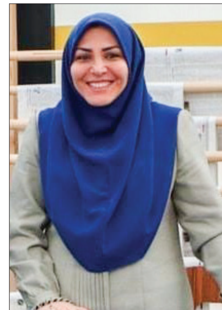
مرخصی ماه | غیبت مشکوک المیرا

ماجرا چه بود؟ فرزاد جمشیدی با اجرای برنامه‌های مذهبی در تلویزیون به شهرت رسید. او با شیوه متفاوت اجرا که مبتنی بر جمله‌های ادبی بود به شهرت رسید. جمشیدی در عین آن که کلامی شیوا داشت، «ساده» حرف می‌زد و به همین خاطر پیش مخاطب عام صاحب محبوبیت شده بود. این مجری سال‌ها است اجازه فعالیت در تلویزیون ندارد؛ با این حال تابستان ۱۴۰۰ برنامه‌ای با نام «روز حسین» در شبکه جام جم اجرا کرد. ظاهر قرار بوده او در رمضان امسال اجرای یکی از ویژه برنامه‌های سحر تلویزیون را برعهده داشته باشد که با مخالفت مدیران مواجه می‌شود. چه واکنش‌هایی داشت؟ ماجرا از خود فرزاد جمشیدی در یک پست اینستاگرامی شروع داد و درباره لغو اجرائش نوشت: «مردم مملکت ما را خدا، سلام، امسال از دو شبکه تلویزیونی برای اجرای برنامه سحر گاهی ماه رمضان، دعوت شده بودم اما... اما ناگهان سفره حرف حساب را برچیدند و دوباره بیمن من و شما در قاب تماشای سینما، جدایی انداختند!» چه فرجامی رقم خورد؟ بعد از حاشیه‌هایی که در اوایل دهه نود برای فرزاد جمشیدی رقم خورد، اجازه اجرا در تلویزیون از او سلب شد. در این سال‌ها او بارها در مقام دفاع از خود برآمد و توضیحاتش را ارائه کرد. با این حال شرایط جمشیدی همانی است که بود!