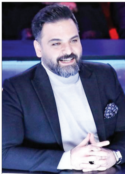
یکه تاژ ماه | عصر جدید پر مخاطب و پر حاشیه