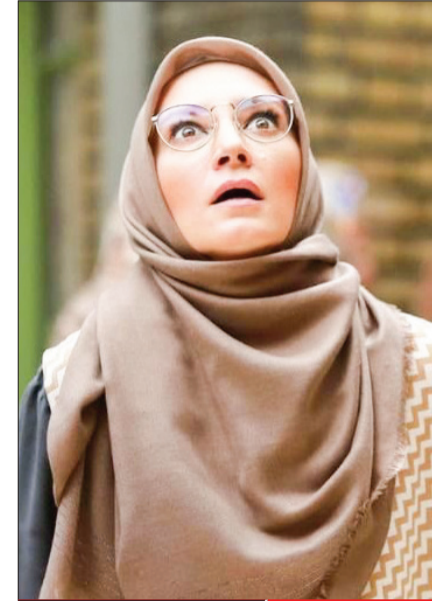
اعتراف ماه | روزگار تلخ سیما

ماجرا چه بود؟ شبکه چهار امسال نیز «زندگی پس از زندگی» با اجرا و تهیه‌کنندگی عباس موزون را به عنوان ویژه‌نامه افطار خود در کنساکتور قرار داد. سری جدید یک تفاوت با فصل‌های پیش دارد و آن داغ شدن بحث درباره موضوع برنامه است. در این برنامه کسانی مقابل مجری حاضر می‌شوند که خروج موقت روح از جسم یا به عبارتی مرگ موقت را تجربه کرده‌اند. برخی صاحب‌نظران موضوع برنامه را انحراف می‌دانند و برخی واقعی و البته راه نجات. چه واکنش‌هایی داشت؟ با بالا گرفتن بحث، روابط عمومی شبکه چهار نظراتی موقف را در قالب یک خبر آماده کرد و در اختیار رسانه‌ها قرار داد. بر این اساس، آیت‌الله مهدی شب‌زنده‌دار عضو فقهای شورای نگهبان و حجت‌الاسلام والمسلمین الهنور کریمی امام جمعه ایلام از جمله کسانی هستند مخاطب را به تشویق به تماشای برنامه کرده‌اند. در میان مخالفان، نام حجت‌الاسلام رضا غلامی، رئیس مرکز پژوهش‌های علوم انسانی اسلامی صدا دیدمی می‌شود که در یادداشتی مفصل برای خبرگزاری مهر، توضیح داده است «زندگی پس از زندگی» و جهات دیدنی ندارد.