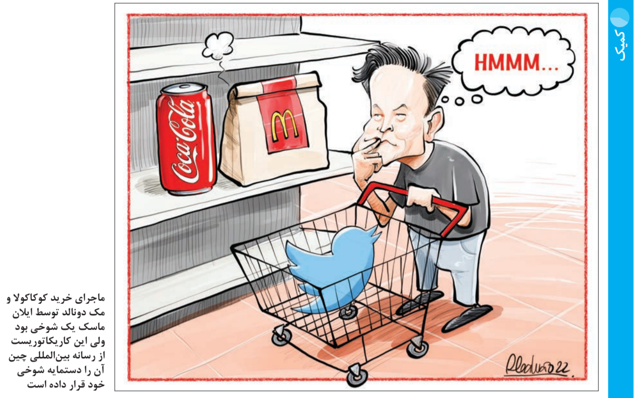
ماجرای خرید کوکاکولا و مک دونالد توسط ایلان ماسک یک شوخی بود ولی این کاریکاتوریست از رسانه بین‌المللی چین آن را دستمایه شوخی خود قرار داده است

اتخاذ کند چرا که سیاست‌های تعاملی مون جان، رئیس جمهوری لیبرال فعلی کره جنوبی تقریباً کارشناسان می‌گویند تهدید کیم به استفاده از نیروهای هسته‌ای خود برای محافظت از «منافع اساسی» کشورش که به طور مبهم تعریف شده است، احتمالاً نشان‌دهنده یک دکترین هسته‌ای تشدیدکننده است که می‌تواند نگرانی بیشتری برای کره جنوبی، ژاپن و ایالات متحده ایجاد کند. کره شمالی تنها در کمتر از ۵ ماهی که از آغاز سال ۲۰۲۲ گذشته ۱۳ دور پرتاب تسلیحاتی انجام داده که از آن جمله نخستین آزمایش تمام برد ICBM این کشور از سال ۲۰۱۷ بوده است. همچنین نشانه‌هایی وجود دارد که کره شمالی در حال بازسازی تونل‌هایی در یک میدان آزمایش هسته‌ای است که آخرین بار در سال ۲۰۱۷ برای آماده‌سازی احتمالی آزمایش انفجار هسته‌ای فعال بود. برخی کارشناسان می‌گویند که کره شمالی ممکن است سعی کند این آزمایش را در فاصله زمانی بین مراسم تحلیف یون سوک یول، رئیس‌جمهور منتخب کره جنوبی در ۱۰ مه و نشست برنامه‌ریزی شده او با جو بایدن، رئیس‌جمهوری ایالات متحده در ۲۱ ماه مه انجام دهد تا تأثیر سیاسی آن را به حداکثر برساند. در حالی که مجموعه موشک‌های ICBM کیم توجه بین‌المللی زیادی را به خود جلب کرده است، کره شمالی از سال ۲۰۱۹ همچنین در حال گسترش زرادخانه موشک‌های کوتاه برد سوخت جامد خود است که کره جنوبی را تهدید می‌کند. ناظران بر این باورند که مذاکرات بی‌نتیجه دولت دونالد ترامپ بر خشم بیشتر کره شمالی افزوده و پیونگ یانگ احساس کرده جز با افزایش تهدیدهای خود علیه آمریکا نمی‌تواند به آنچه می‌خواهد دست یابد.