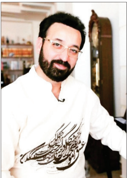
نُه ماه | مجوز جمشیدی صادر نشد

ماجرا چه بود؟ خیلی معمول نیست که مدیران تلویزیون در فضای عمومی، ضعف‌ها و شکست‌ها را بپذیرند. پیمان جلیلی اما در دیدار با هنرمندان چنین کرد: «در کاهش مخاطبان صداوسیما همه مقصریم». رئیس سازمان صداوسیما در این دیدار تأکید کرد که هیچ کدام از سریال‌های تلویزیون متوقف نشده‌اند. چه واکنش‌هایی داشت؟ بخش اول گفته‌های جلیلی تا چند روز تیرتر اول رسانه‌ها بود. چهره‌ها و کارشناسان مختلف تعبیری از این صحبت ارائه کردند و پیش‌نهاد خود برای بازگشت تلویزیون به روزهای اوج را به اشتراک گذاشتند. واقعیت این است که تلویزیون به موقفیت نمی‌رسد مگر آن‌که کار به دست کاربان بیفتد. درباره بخش دوم صحبت‌های جلیلی یعنی تکذیب توقف سریال‌ها واکنش پرنرنگی شکل نگرفت. روز گذشته نام سریال‌هایی که به‌رغم داشتن قرارداد متوقف شدند را نوشتیم. اگر آن سریال‌ها (که صاحب‌کار گردان و تهیه‌کنندگان خوش سابقه هستند) سخاوت می‌شدند، در رمضان امسال شاهد افت مخاطب نمی‌بودیم. چه فرجامی رقم خورد؟ فعلاً که تلویزیون با همان دست فرمان پیش می‌رود و در دومین بازه زمانی طلایی ۱۴۰۱ هم شاهد انبوه سریال‌ها و برنامه‌های کم مخاطب هستیم. حتماً پیمان جلیلی تجربه ناکام نوروز و رمضان را برای بهتر شدن وضعیت آنتن در طول سال به کار خواهد بست.