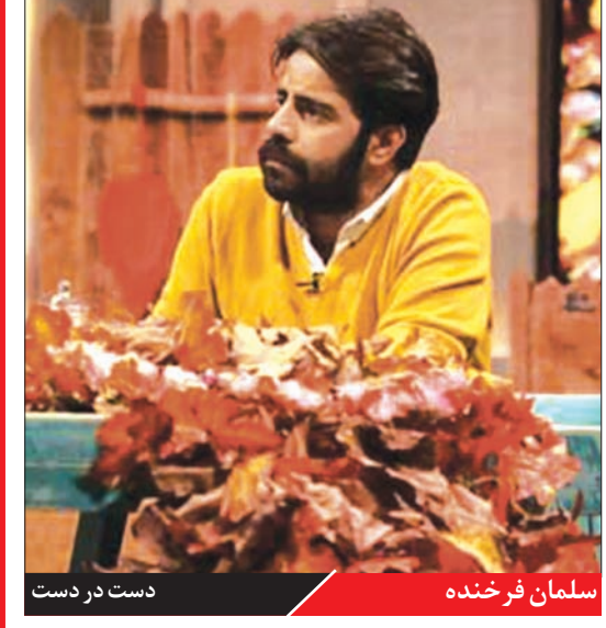
سلمان فرخنده دست در دست

شبکه ایران ، بخشی از عدم موفقیت سلفه به اجرای محدودیت‌های کربلایی و حذف تماشاچیان برمی‌گشت. سلفه با توجه به موضوعش پسانلس خوبی برای تبدیل شدن به یک اثر در حد چک داشت اما این ایده‌ها به جهت مناسبتی پشت و رفت و موفقیتی نصیب برنامه نداشت.