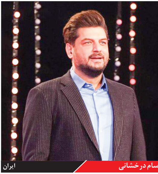
سام درخشانی ایران

شبکه ایران ، «شو» مدت زمان کوتاهی (۱۲ قسمت) تولید شد در این مدت بیشتر از اینکه به‌واسطه جاذبیتش مطرح شود، به‌عاطر جوانی‌ای که داشت سر زبان‌ها افتاد. حاشیه‌های صحبت‌ها اگر عیدی درباره محضرها صلی‌نیایی و رئیس جمهور رفت، باعث شد برنامه برای مدتی متوقف شود و محلی برای بحث‌های پاشخویی شود اما بعد از آن هم مدت زمان زیادی طول نکشید که برنامه به اتمام رسید.