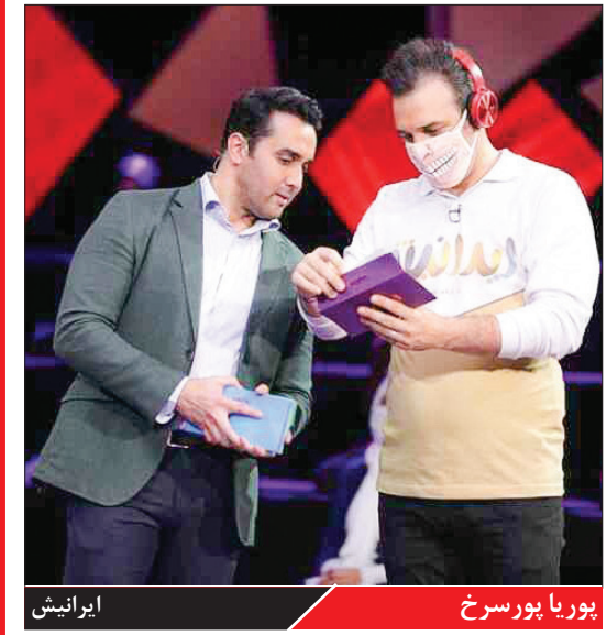
بوریا پورسرخ ایرانی‌ش

شبکه ایران ، پوریا پورسرخ از اوایل دهه هشتاد به‌عنوان بازیگر شناخته‌شد و فیلم‌ها و سریال‌های مختلفی بازی کرد اما هیچ‌وقت پیش از این سلفه اجرا نداشت. او اولین بار زمستان ۱۳۹۰ با اجرای سلفه ایرانی‌ش به این عرصه‌راه پیدا کرد. شبکه ایران ، در اولین قسمت سلفه که با حضور چند چهره شناخته‌شده مقابل دوربین رفت، اجرای خوبی نداشت اما کم‌کم نواست به خودش مسلط شود و سروسامانی به اجراش بدهد. پورسرخ برخلاف بسیاری از مجرانی که تلاش می‌کنند با آدا و لااوپاییان پریند، یک سلفه را جذاب کنند، تلاشی برای این امر انجام نمی‌داد اما به‌صورت ذاتی هم شخصیت سروسوا و پر هیجانی نداشت، او در اجرا میدادی آداب بود و سعی می‌کرد مراحل مختلف را طبع اصول، پیش ببرد اما خوب در رفتارش هیچانی دیده نمی‌شد. آراش پورسرخ شاید می‌توانست در کنار شور و هیجان تماشاچیان داخل استودیو تا حدودی خنثی شود اما مشکل ایجادبود که تماشاچی‌ها هم هیجانی ایجاد نمی‌کردند و همین باعث شد سلفه جاذبیت چندانی نداشته باشد.