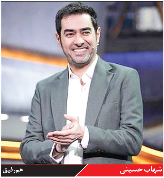
شهاب حسینی هفر رفیق

شبکه ایران ، پیشگو برنامه به‌طور موفقیت بود. هم به لحاظ دعوت از مهمان‌ها زیاده به‌جا کرد اما اینکه پسانلس زیادی برای تبدیل شدن به یک برنامه جذاب بر مخاطبان داشت، آنطور که باید موفق نبود. درست است که بعضی مهمان‌های درجه یک هم مهمان برنامه شده‌اند اما از حضور آنها برای تبدیل کردن برنامه به یک اثر شاخص استفاده نشد.