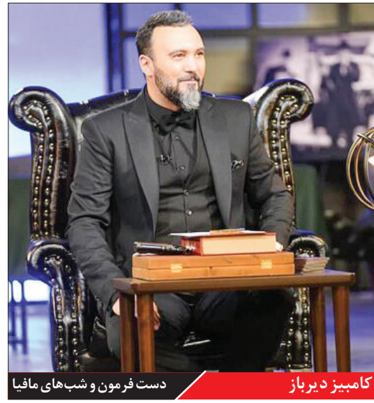
کامیوز دیرباز دست فرمون و شب‌های مافیا

شبکه ایران ، «دست فرمون» با اینکه سلفه جدید و جذابی نظظر می‌رسید اما نظظر که باید در جلب مخاطب موفق نبود. البته در فصل اول به نسبت قدرتمند ظاهر شد و در ادامه به‌جایی رسید. «شب‌های انتخاب» برنامه جذاب و پر مخاطبی بود و این جذابیت با پایان‌ها هم ایدار پیدا کرد و مخاطبان کلان را گیر آن شدند.