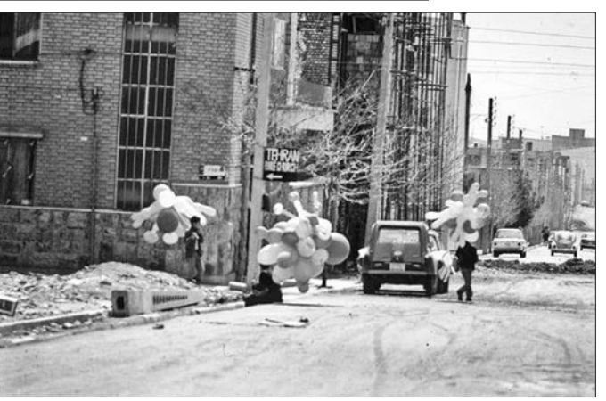
قاب نوستالژی ۲ تهران حوالی خیابان ظفر (دستگردی) دهه ۵۰