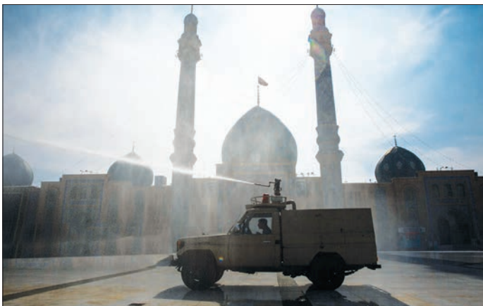
گردان جنگ نوین لشکر عملیاتی سپاه علی ابن ابیطالب قم، با استفاده از تجهیزات رفع آلودگی زمین و اماکن و معابر این شهر کرد.