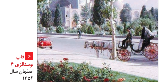
قاب نوستالژی ۴ اصفهان سال ۱۳۵۲