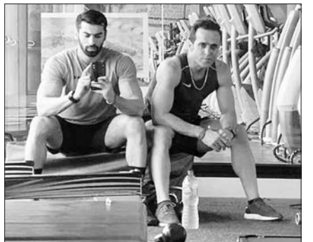
عکسی از علی کریمی در باشگاه بدنسازی و شعری از فریدون مشیری در کپشن عکس.