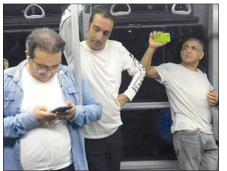
امیرمهدی ژوله نوشته: حریم خصوصی. من گوش می‌دم، ما، مانی حقیقی من را و هستی مهدوی ما را. بندرعباس در حال ملاقات با جادوگر.