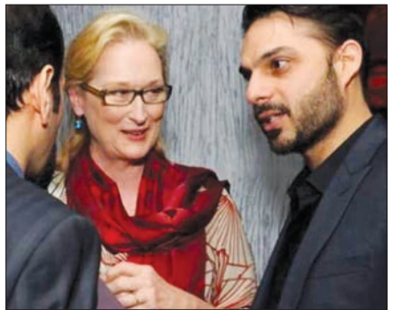
پیمان معادی این عکس از خودش در کنار اصغر فرهادی و مریل استریپ را به اشتراک گذاشته.

اینستا گرافی (منتخبی از اینستاگرام جهره‌ها)