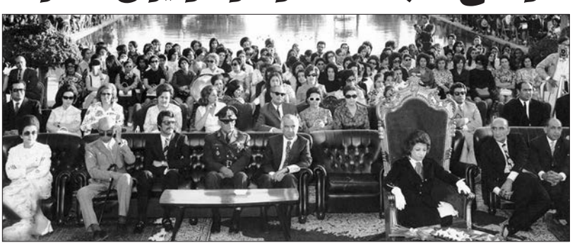
۸ اشرف ریاست سازمان شاهنشاهی خدمات اجتماعی هنگام شرکت در یک مراسم رسمی