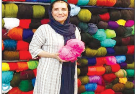
۸ بیست کاموایی فریبا کورنی در اینستاگرامش.